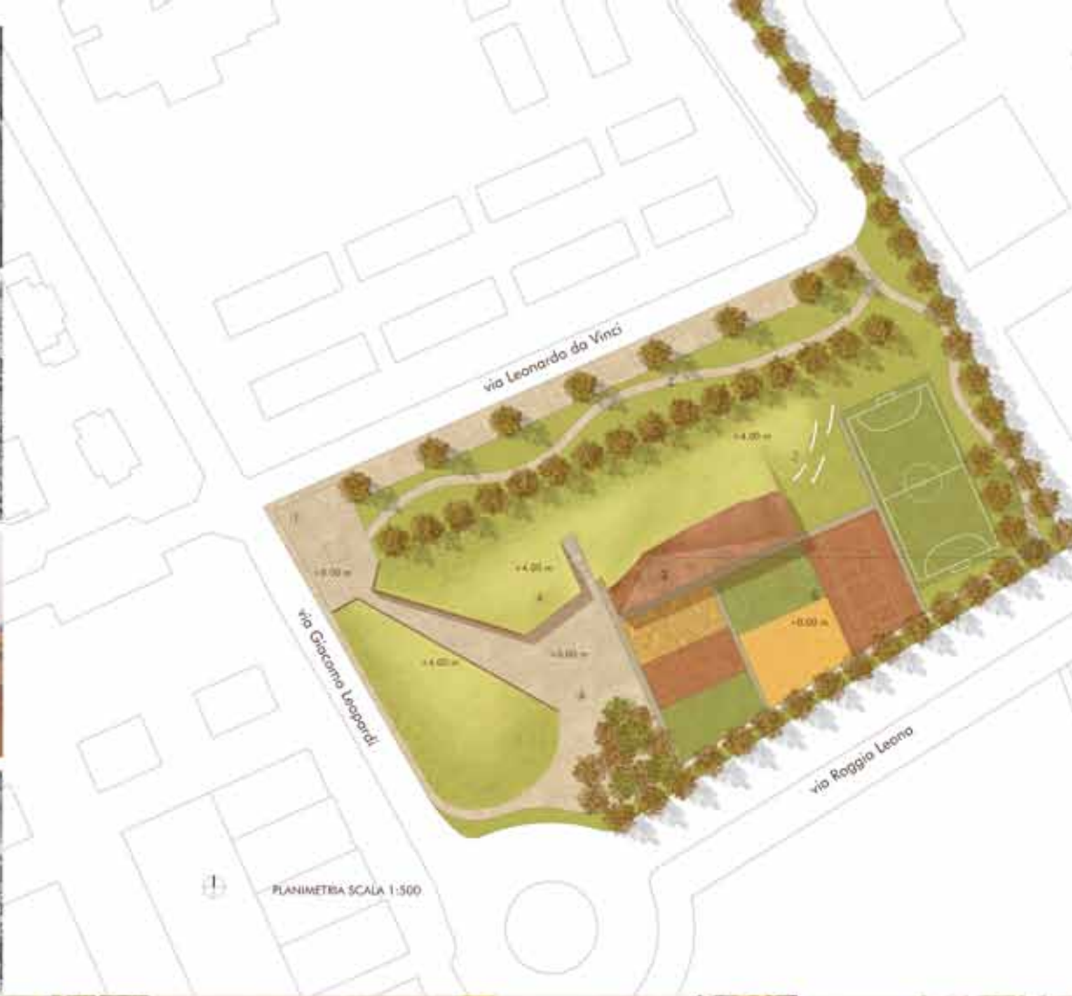
PLANIMETRIA SCALA 1:500