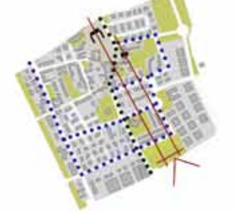
gli elementi del progetto: il paesaggio agricolo, il nucleo antico, i percorsi verso le aree pubbliche e restaurabili dello site