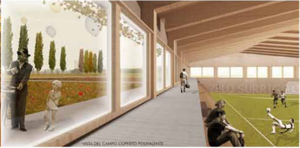
VISTA DEL CAMPO COPERTO POLIVALENTE