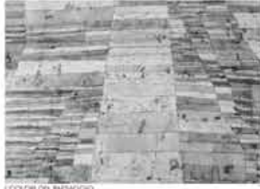
IL DIRIGIO DEL PAESAGGIO