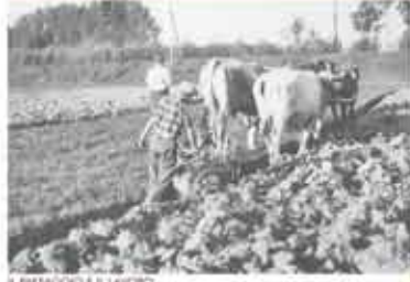
IL PAESAGGIO E IL LAVORO