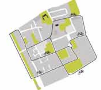
il sistema del verde: le piste ciclabili, collegamento leggero e urbano