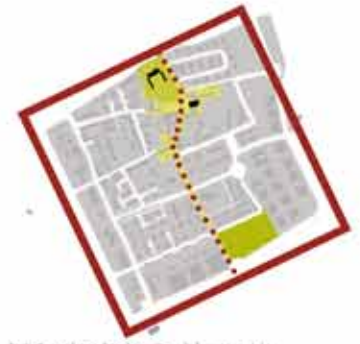
la struttura urbanistica: il nucleo antico e la forma consolidata della recente espansione

Campo polivalente coperto senza annessi servizi e zona ristoro Superficie edificata nel rispetto degli indici urbanistici (art. 28 NTA)