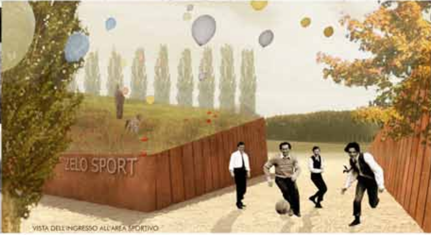
VISTA DELL'INGRESSO ALL'AREA SPORTIVO